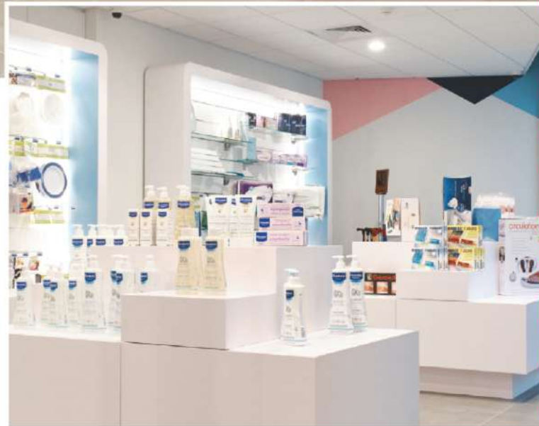
De MATPLUS-winkel van Tienen heeft een mooi aanbod.